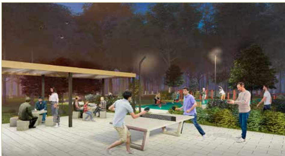
В обновлённом парке появятся столы для пинг-понга и шахмат.

нему дорожке. В паркетном мощении плиткой можно будет разглядеть форму спичек. Компанию скамейкам составит ограждение из разновысоких деревянных брёвен, рядом высадят осины — именно из этой породы дерева изготавливали спички.