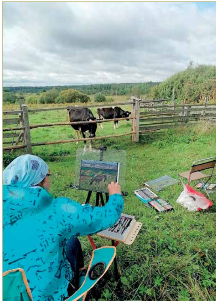
К слову, коровы с удовольствием позировали художникам.

— В детстве я два года училась в художественной школе. Рисовать любила всегда. Выяснилось, что и в Кировском живут люди, готовые вместе со мной выйти на свежий воздух с мольбертами. Сначала организовывала пленэры рядом с