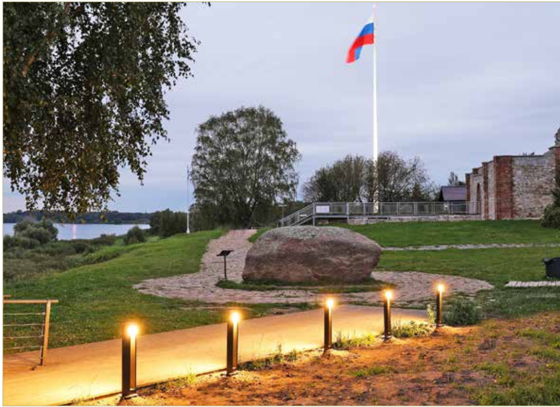
Новшества в виде стильных светильников добавили месту дополнительной фотогеничности.

Впрочем, практика показывает, что проводить вечера на высоком берегу Волхова приятно и удобно даже в холодную погоду. Главное — запастись термосом с горячим чаем или кофе, а также комфортной, тёплой одеждой.