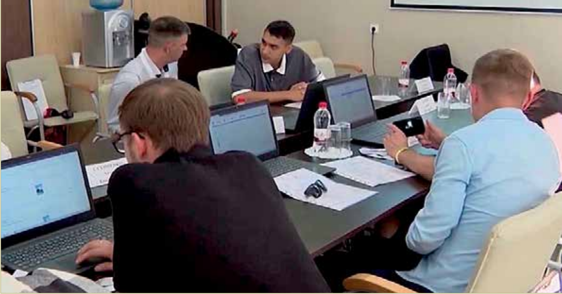
В Штабе общественного наблюдения за выборами внимательно следили за ходом голосования.