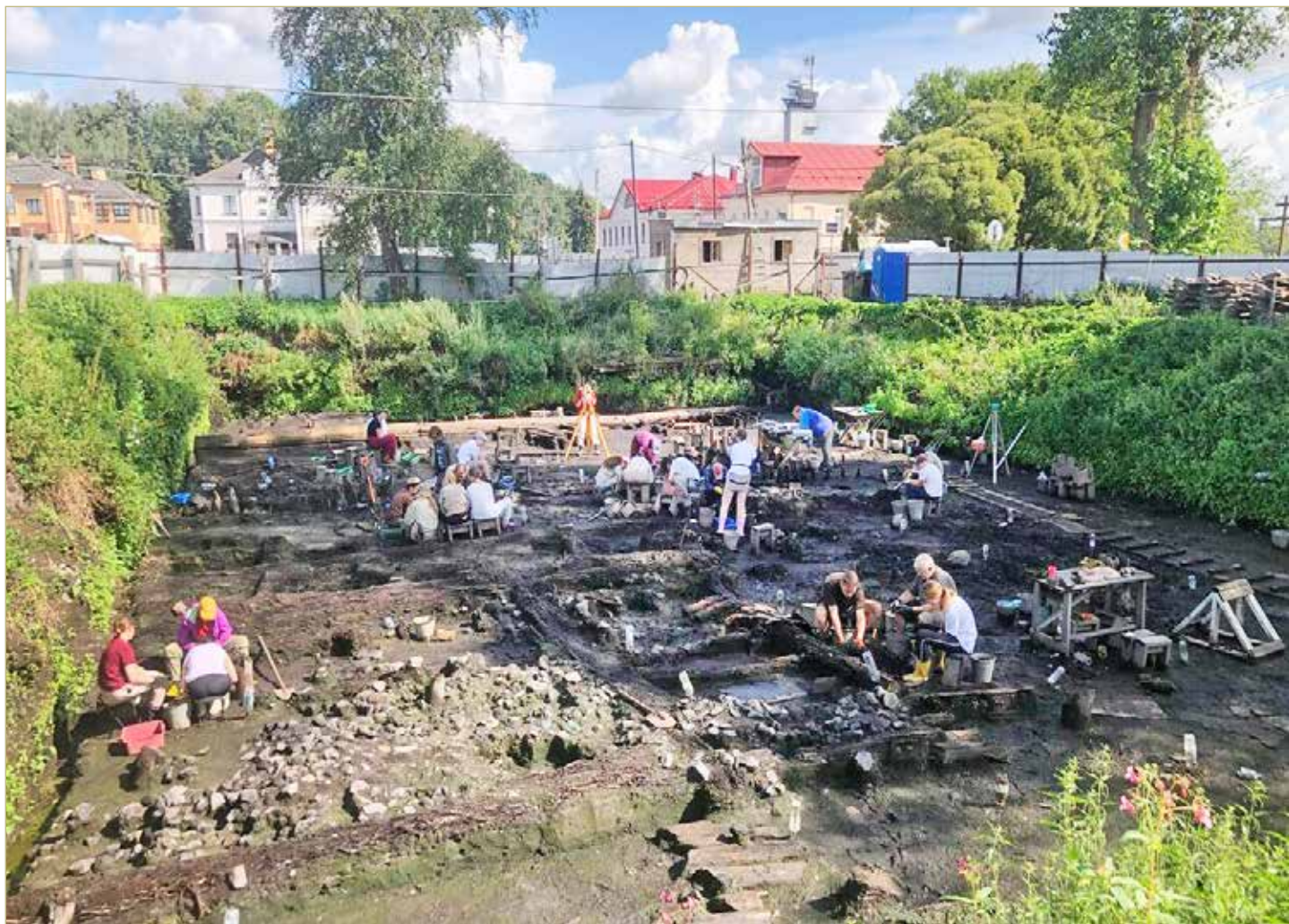
В этом году обнаружено всего пять берестяных грамот: четыре на Троицком раскопе и одна на Иоанновском.

1233-й номер получило берестяное письмо с Иоанновского раскопа, который заложили в 2021 году недалеко от