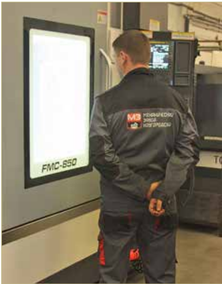
Программа «Сделано в России» позволила «Механическому заводу Новгородский» подтвердить качество продукции на международном уровне.

Благодаря областным мерам поддержки предприятию удалось расширить производственные мощности и создать экспериментальный цех. В настоящее время на его базе в рамках программы импортозамещения реализуются проекты с инновационными разработками. В результате цех зарегистрировал несколько патентов на полезные модели и изобретения. Кроме того, на средства грантов, предоставленных министерством промышленности и торговли Новгородской области, были проведены