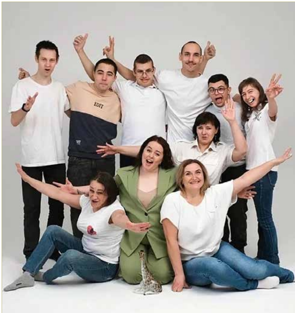
В мастерской рождается красота, созданная руками особенных мастеров, и совершаются маленькие и большие жизненные чудеса.

Правда, «Жирафу» нужно было время, чтобы встать на ноги: возникли на его пути препятствия — помещение сильно пострадало от потопа. А когда стоимость аренды 20 квадратных метров мастерской резко увеличилась, то пришлось задуматься о переезде. Даже появились мысли о закрытии.