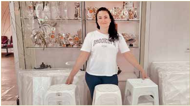
Авторы проекта готовятся открыть гончарню в октябре.

Учебный процесс будет длиться до конца августа 2026 года. Параллельно с наработкой навыков начинающие гончары станут участниками трёх больших традиционных фестивалей