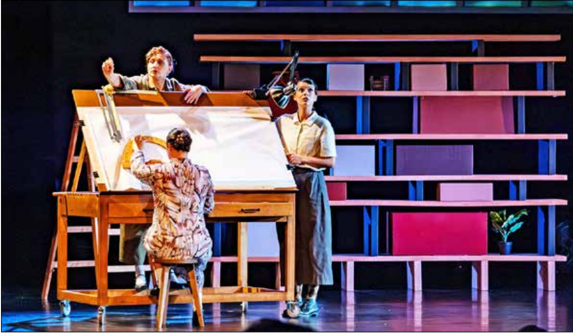
Роль Шарлотты в разные периоды её жизни играют три актрисы.