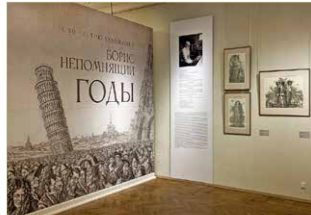
Юбилейная выставка «Годы» будет работать по 3 ноября 2025 года.