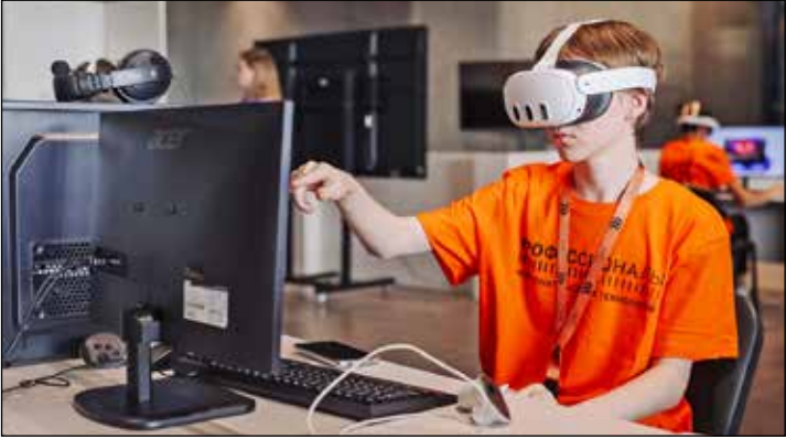
Часть компетенций связана с информационными технологиями.

С 17 по 21 сентября Великий Новгород в третий раз принимает финал Чемпионата высоких технологий, который станет соревновательной площадкой для более чем 140 конкурсантов из России и зарубежных стран.