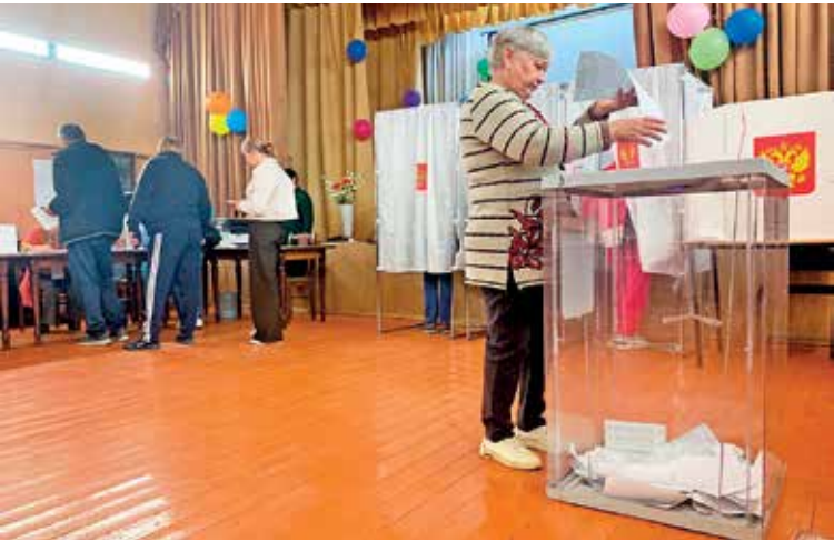
В Боровичском округе явка составила 32% с учётом ДЭГ.