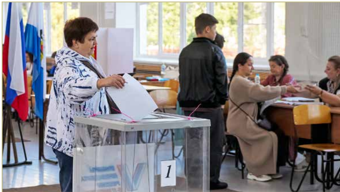
В Новгородской области в дни голосования работали 520 избирательных участков.

В НОВГОРОДСКОЙ ОБЛАСТИ ЗАВЕРШИЛСЯ ВЫБОРНЫЙ МАРАФОН — С 12 ПО 14 СЕНТЯБРЯ В РЕГИОНЕ ВЫБИРАЛИ ГУБЕРНАТОРА И ДЕПУТАТОВ ДУМ В 15 МУНИЦИПАЛЬНЫХ ОКРУГАХ