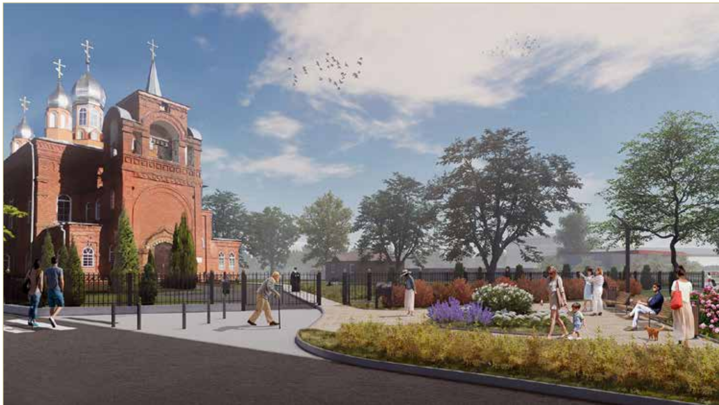
У церкви Казанской иконы Божией Матери, которая находится недалеко от парка имени 1 Мая, создадут зону отдыха.

На втором этапе благоустройства тему производства спичек продолжит новая зона отдыха, которую оборудуют у церкви Казанской иконы Божией Матери. Она находится в нескольких десятках метров от парка, рядом с ведущей к