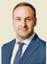
Николай ШВАБОВИЧ , кандидат в губернаторы Новгородской области от партии «Справедливая Россия — Патриоты — За правду»:

— Губернаторские выборы, выборы в Государственную Думу, которые пройдут в 2026 году, — они определяют нашу жизнь на ближайшие пять лет. Всё зависит от нас, как люди проголосовали, так мы и будем жить.